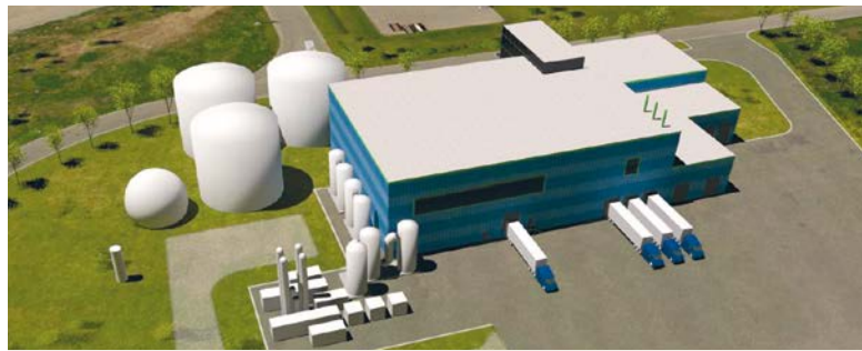
Plan-image du futur centre de biométhanisation

Le 14 septembre dernier, la Ville rencontrait les citoyens pour faire le point sur le projet de construction du centre de biométhanisation.