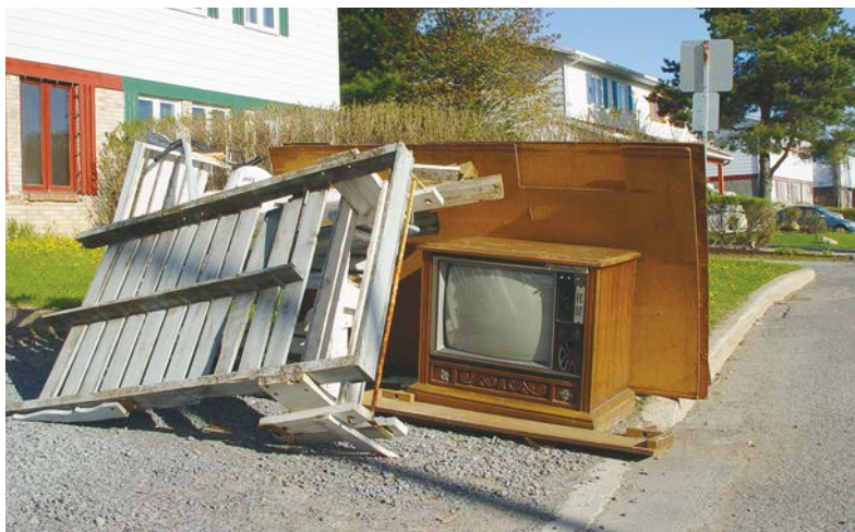
Avant de déposer vos encombrants en bordure de la rue, inscrivez-vous au service de collecte.

Si vos objets sont encore en bon état, pourquoi ne pas les donner à un organisme de charité ou à une entreprise d'économie sociale? Certains offrent même un service de collecte à domicile. Pour vous aider, consultez le Bottin du réemploi au www.reduiremesdechets.com .