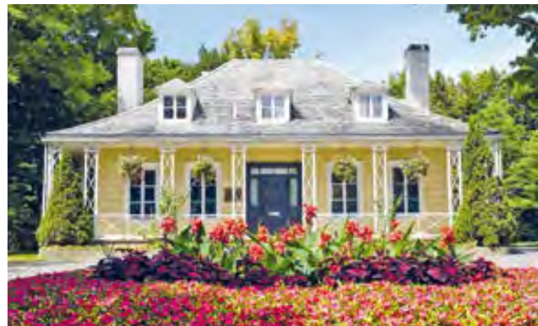
L'exposition Anthropocène : la contemplation de la menace est de nouveau présentée à la Maison Hamel-Bruneau jusqu'au 16 mai.

Pour connaître les activités offertes, les expositions en cours, les coûts d'entrée de même que les heures d'ouverture lorsque les conditions sanitaires le permettent, rendez-vous sur le site Internet au www.maisonsdupatrimoine.com .