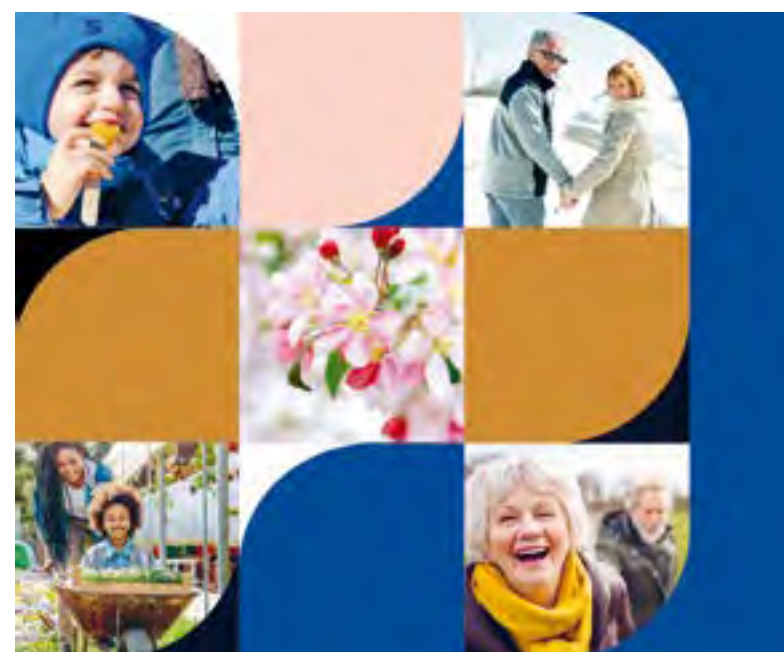
Toutes les activités proposées sont gratuites et sécuritaires.

Les choix sont nombreux pour vous divertir dans le confort de votre foyer. Les enfants raffoleront de la sélection de films offerte dans le cadre du Festival de cinéma