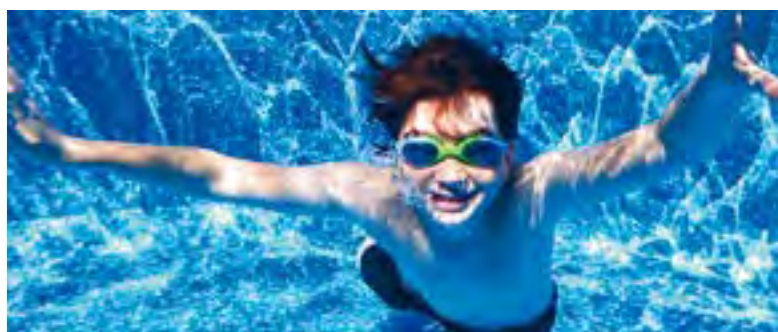
Cette année encore, les piscines privées auront la cote. Informez-vous sur les normes avant de plonger dans l'aventure.

Renseignements : www.ville.quebec.qc.ca/installation-piscine .