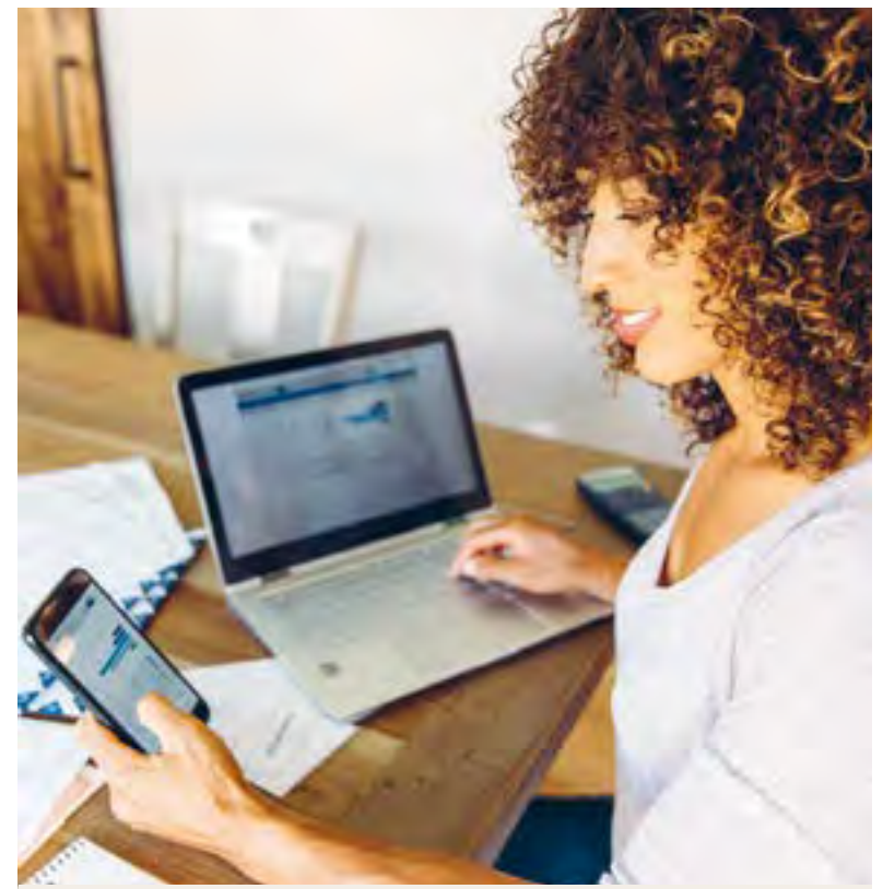
La Ville offre près d'une vingtaine de services différents en ligne.