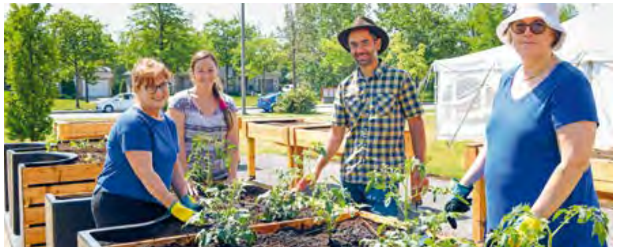
Nouveauté! Des jardins en bacs seront aménagés hors sol pour ceux qui préfèrent jardiner debout.

Renseignements : Composez le 311 ou visitez le www.ville.quebec.qc.ca/jardinsmunicipaux .