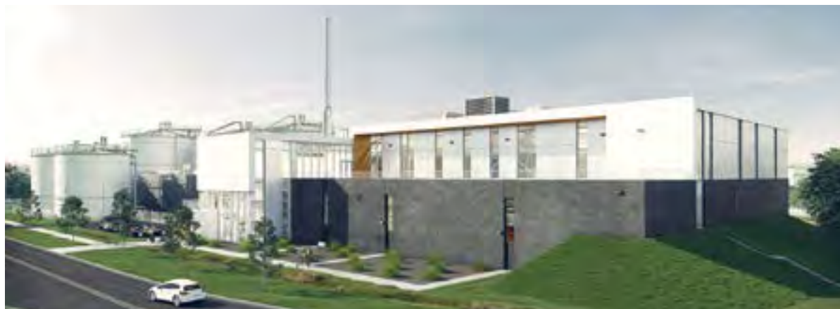
Aperçu du Centre de biométhanisation de l'agglomération de Québec, dont la mise en service pour la biométhanisation des boues municipales est prévue en 2021 et celle des résidus alimentaires en 2022.

des ouvrages d'art, des ouvrages d'eau et d'assainissement;