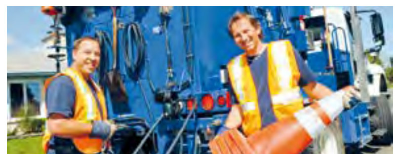
Le nettoyage des rues est une affaire d'équipe entre les employés de la Ville et les citoyens.

orange seront installés aux abords de la rue au plus tard la veille des travaux pour vous prévenir de déplacer votre voiture. Si vous ne le faites pas, vous serez remorqué. Pour éviter cette situation fâcheuse, consultez le calendrier des opérations au www.ville.quebec.qc.ca , dans la section Citoyens/Travaux dans les rues/Nettoyage printanier .