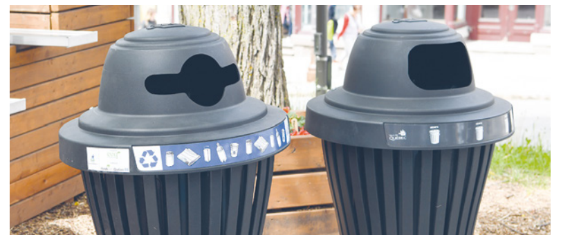
Écocentre, Écocentre mobile et corbeille de rue en duo font partie des 71 actions réalisées ou en voie de l'être.