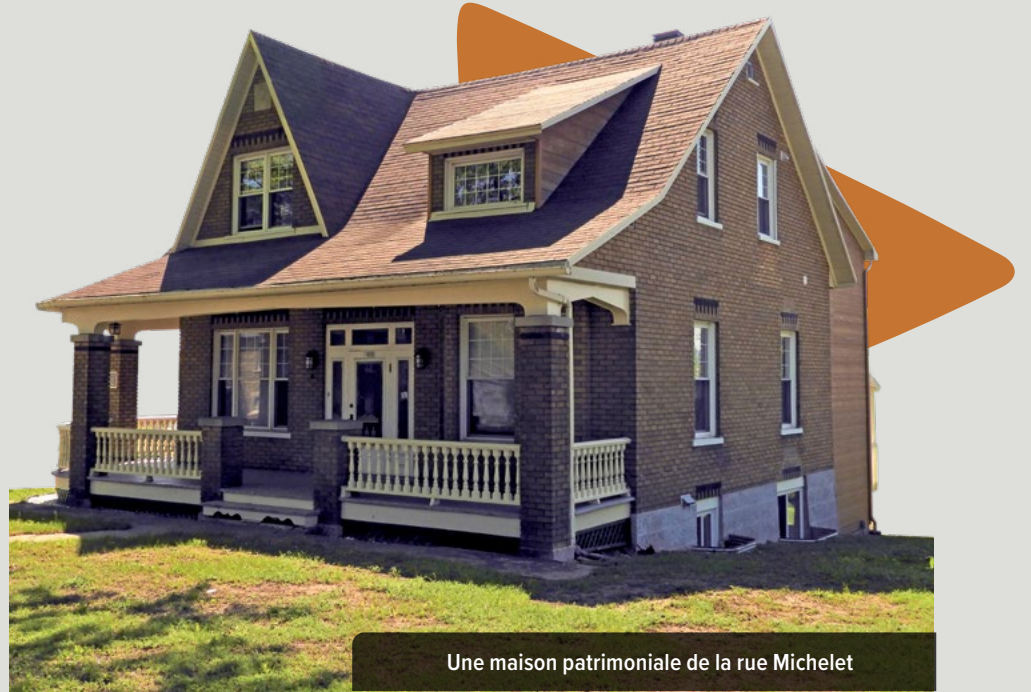
Une maison patrimoniale de la rue Michelet

ville.quebec.qc.ca/citoyens/patrimoine/bati