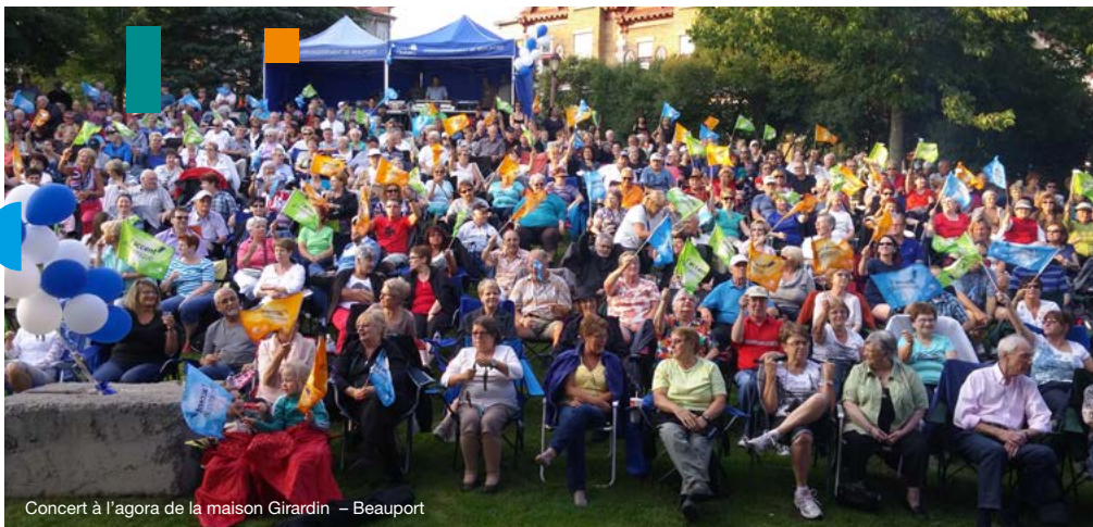
Concert à l'agora de la maison Girardin – Beauport

Soutenir le travail de collaboration des artistes et des organismes culturels avec les citoyens.