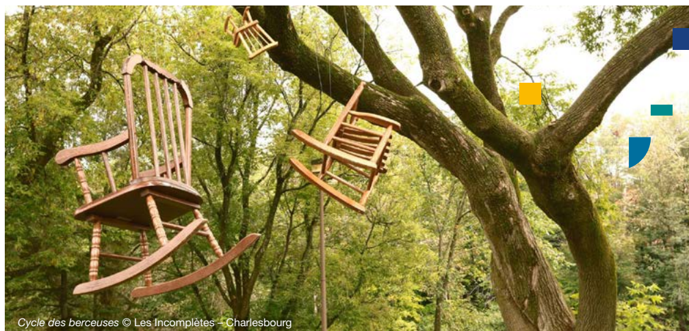
Cycle des berceuses © Les Incomplètes – Charlesbourg

Faire de la recherche, de la créativité et de l'innovation des moteurs de développement économique et culturel pour les citoyens et les touristes.