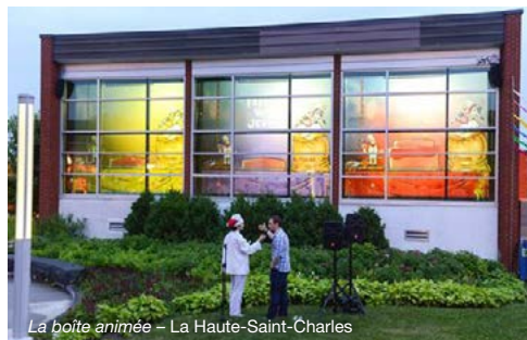
La boîte animée – La Haute-Saint-Charles