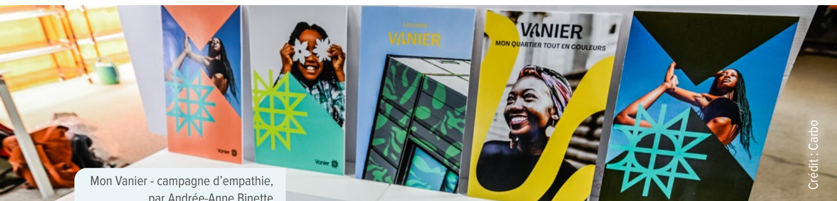
Mon Vanier - campagne d'empathie, par Andrée-Anne Binette et Catherine Chriscelia Jean-Baptiste