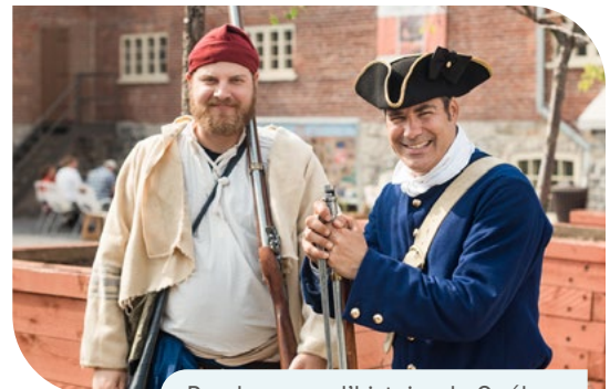
Rendez-vous d'histoire de Québec

Depuis 2023, la Ville de Québec offre une nouvelle aide financière aux artistes grâce à la Mesure d'appui aux artistes professionnels Le Levier, qui les soutient pour différentes étapes de leur projet artistique, notamment en recherche et création. Cette nouvelle mesure offre un soutien direct aux artistes professionnels œuvrant sur son territoire qui ne peuvent plus bénéficier de la mesure Première Ovation, afin de contribuer à leur reconnaissance et à la consolidation de leurs conditions de pratique. Elle se veut complémentaire aux autres mesures existantes à la Ville de Québec.