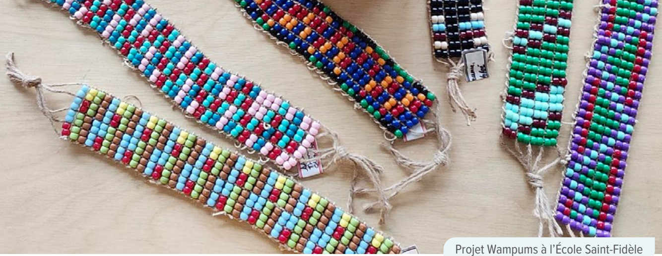
Projet Wampums à l'École Saint-Fidèle