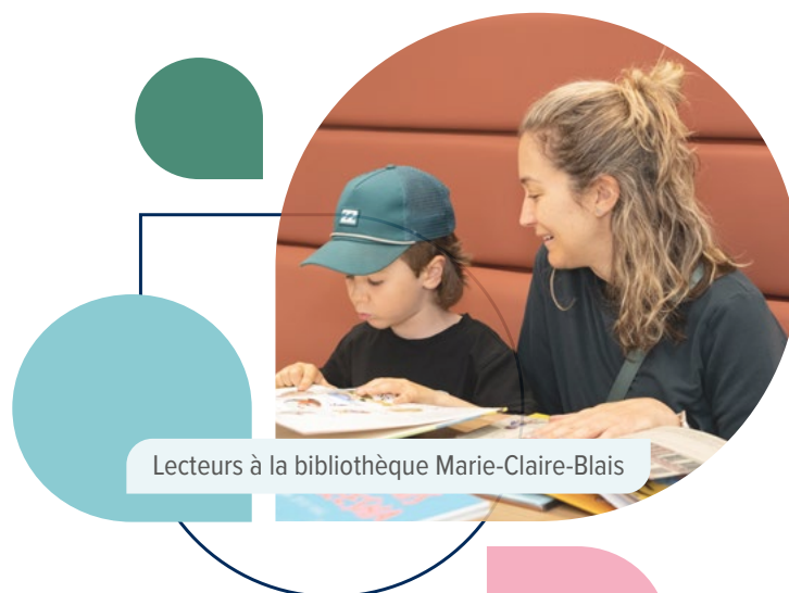
Lecteurs à la bibliothèque Marie-Claire-Blais