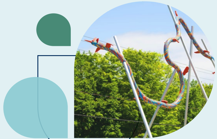
Dragon d'eau danse au parc Chauveau, par Fanny Mesnard