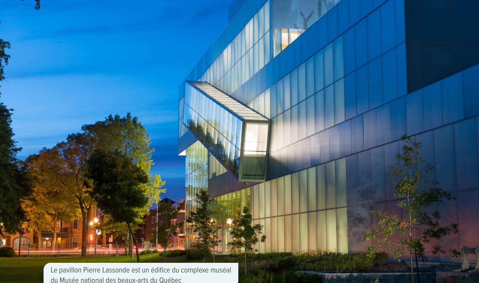
Le pavillon Pierre Lassonde est un édifice du complexe muséal du Musée national des beaux-arts du Québec