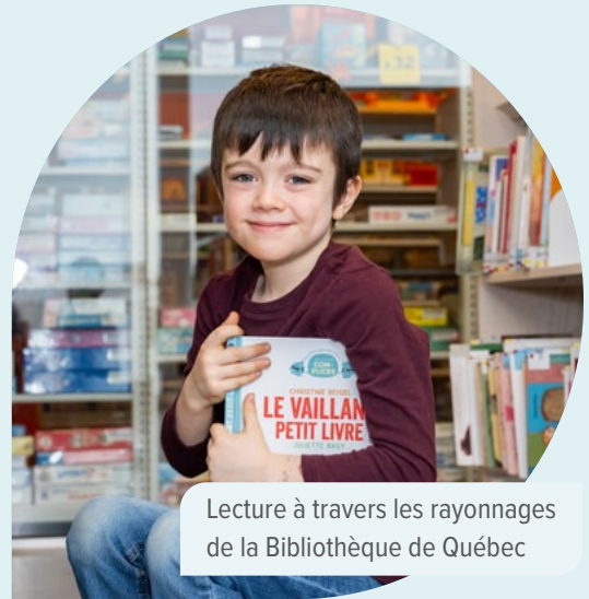
Lecture à travers les rayonnages de la Bibliothèque de Québec

Le Service de la culture et du patrimoine collabore avec plusieurs partenaires, dont :