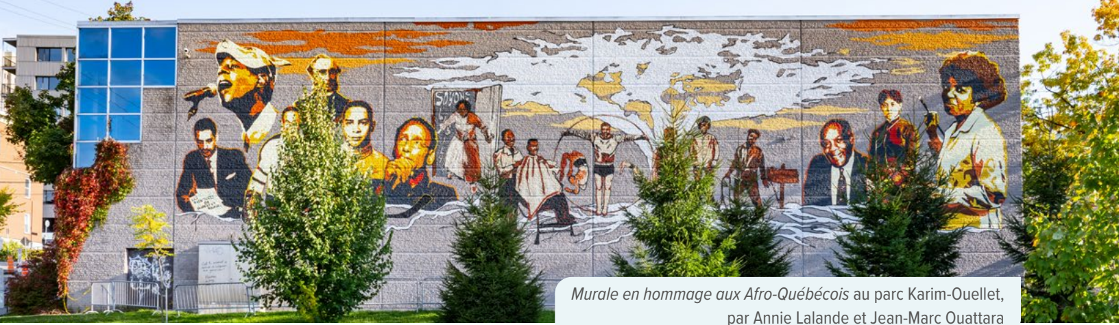
Murale en hommage aux Afro-Québécois au parc Karim-Ouellet, par Annie Lalande et Jean-Marc Ouattara