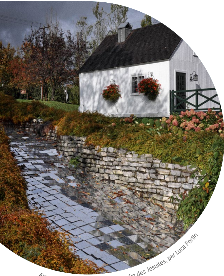
Apporter de l'eau au moulin au Moulin des Jésuites, par Luca Fortin