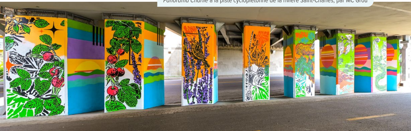
Panorama Charlie à la piste cyclopiétonne de la rivière Saint-Charles, par MC Grou