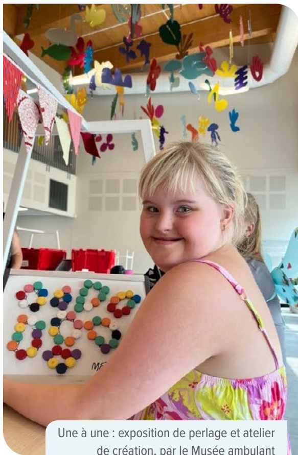
Une à une : exposition de perlage et atelier de création, par le Musée ambulant

Par la présente politique, la Ville de Québec s'assure que toute la population, où qu'elle soit sur le territoire, ait accès à une programmation culturelle de grande qualité, de même qu'à un contexte propice à la pratique du loisir culturel. Il faut limiter les obstacles qui empêchent certains publics, notamment les familles, les personnes en situation de handicap et d'autres clientèles spécifiques, d'avoir accès aux activités artistiques et patrimoniales, de même qu'aux lieux culturels. L'accessibilité est aussi entendue ici comme la possibilité pour les artistes et les organismes de créer, de produire et de diffuser la culture dans les espaces appropriés.