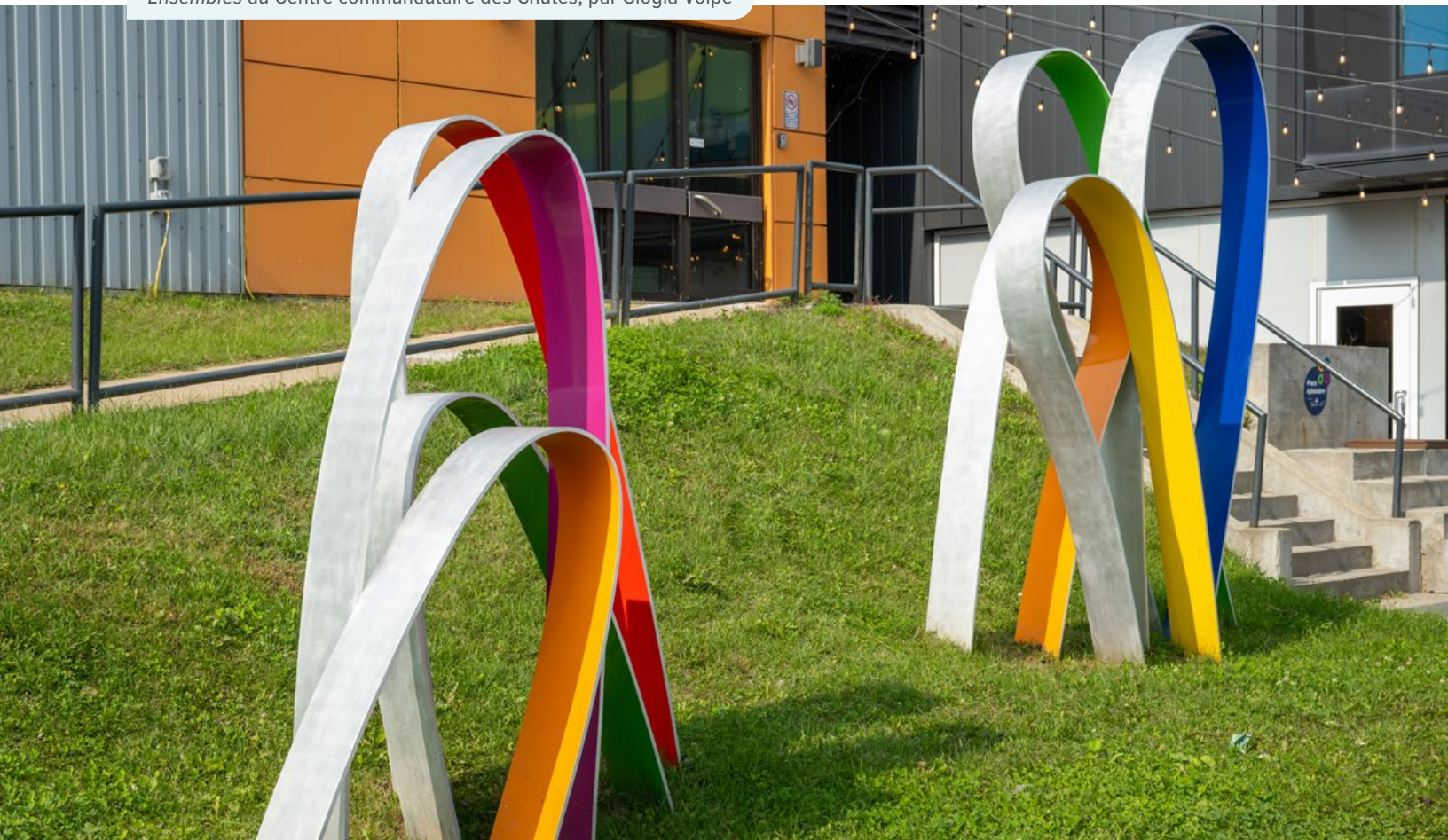
Ensembles au Centre communautaire des Chutes, par Giogia Volpe

Enfin, le Service de la culture et du patrimoine de la Ville de Québec planifie et coordonne les actions culturelles nationales et internationales de la Ville. Il vise, de plus, à accroître la notoriété et le rayonnement de Québec afin d'en maximiser les retombées institutionnelles, économiques, touristiques et culturelles.