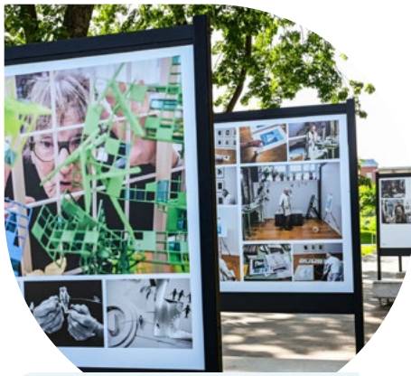
Vivre et vieillir à Québec, par Manif d'art et Renaud Philippe