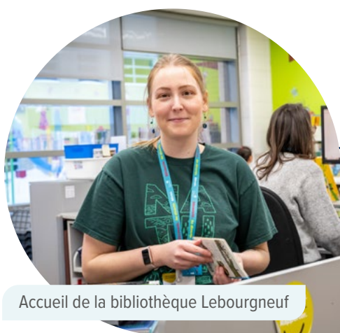
Accueil de la bibliothèque Lebourgneuf