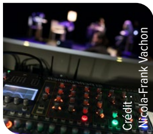
Activité de Première Ovation

Une communication centralisée permet de faire connaître l'offre culturelle disponible sur tout le territoire, tant à la population qu'au public touristique et excursionniste. Les outils de communication, aussi bien imprimés que virtuels, varient selon les besoins et les publics cibles. Le rayonnement, en faisant découvrir la richesse des expressions culturelles de la ville de Québec, contribue à attirer et à retenir les auditoires. De plus, il met en lumière les artistes, les créateurs et les artisans d'ici à l'échelle nationale et internationale.