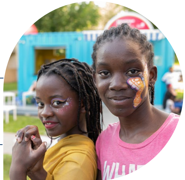
Fête d'ouverture de la bibliothèque éphémère Saint-Pie-X