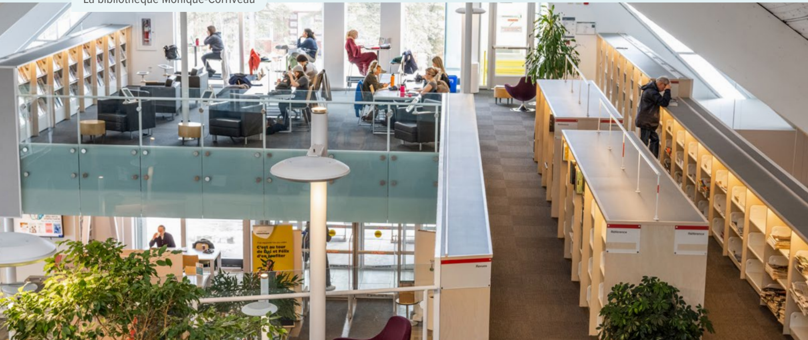
La bibliothèque Monique-Corriveau