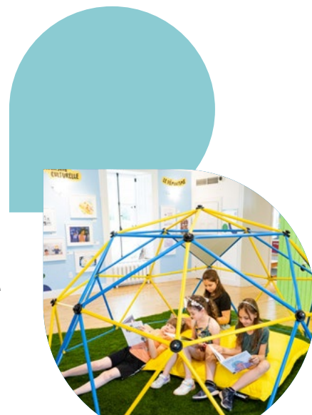
Les imaginaires de la jeunesse, au Centre d'interprétation historique de Sainte-Foy

Les événements culturels majeurs, tels que les festivals, les expositions et les spectacles, attirent un grand nombre de visiteurs chaque année, contribuant aux retombées économiques locales. Le tourisme culturel génère des bénéfices importants pour les commerces, les hôtels, les restaurants et les autres services, stimulant ainsi l'économie de la région et renforçant l'attractivité touristique de Québec.