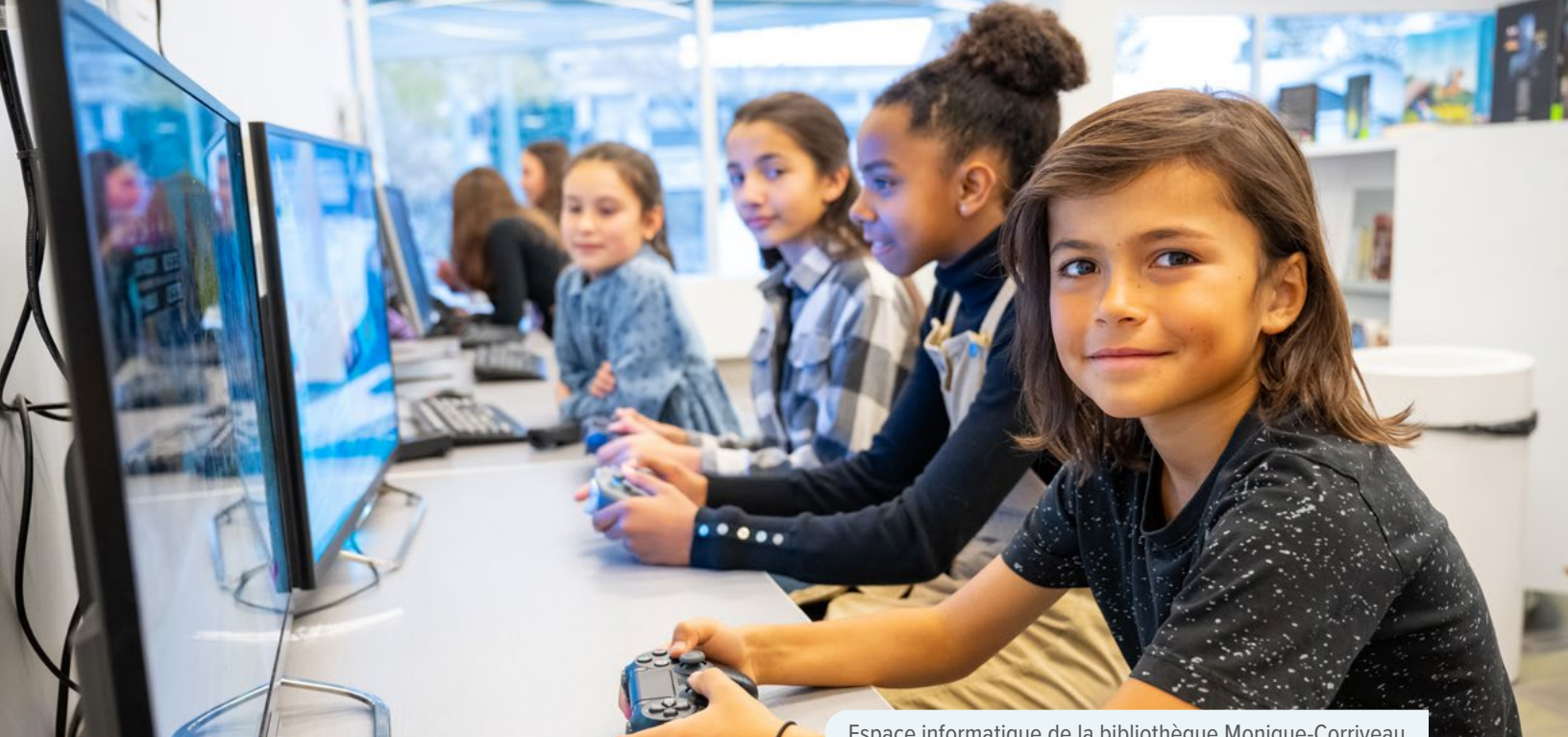
Espace informatique de la bibliothèque Monique-Corriveau