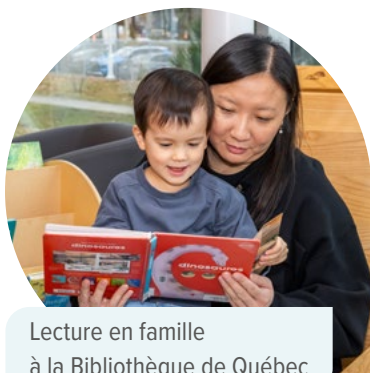
Lecture en famille à la Bibliothèque de Québec