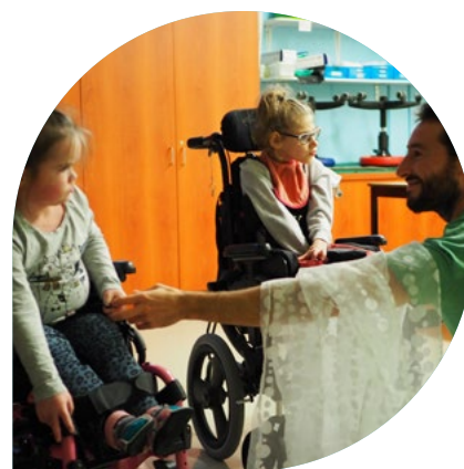
Sensibilité et poésie en mouvement à l'école spécialisée de l'Envol, par Le Papillon blanc danse

Plusieurs études démontrent les impacts favorables de la culture sur le sentiment d'appartenance à une communauté, l'ouverture à la diversité, la participation sociale, l'épanouissement personnel, la transmission de valeurs et de traditions.