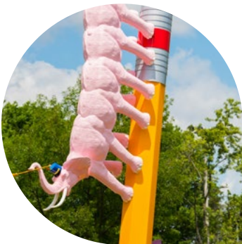
Dessine-moi une chenille au parc Bardy, par Cooke-Sasseville

Stimuler la vitalité culturelle de Québec, la pluralité de ses formes d'expression et son rayonnement partout sur son territoire, voire jusqu'à l'international. La Politique culturelle 2025-2030 facilite l'accès aux activités et aux lieux artistiques et patrimoniaux pour la population, quelle que soit sa situation, de même que pour les visiteurs partout et en tout temps.