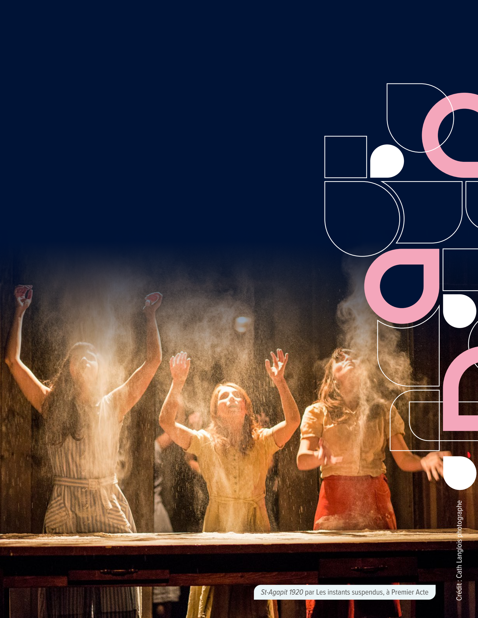
St-Agapit 1920 par Les instants suspendus, à Premier Acte