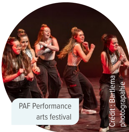
PAF Performance arts festival

La mesure Première Ovation , implantée en 2008 par la Ville de Québec, appuie les jeunes artistes de toutes les disciplines en leur donnant les moyens de créer et de vivre leurs premières expériences professionnelles. Extraordinaire vecteur de rétention et d'attractivité, cette mesure unique au Québec soutient la relève dans 13 disciplines.