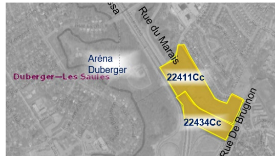
Figure 1 Localisation des zones 22434Cc et 22411Cc

La Ville explique qu'il s'agit d'un pôle commercial avec des services ciblés pour les résidents du secteur et qu'elle souhaite y concentrer ce type d'offre pour la population, plutôt que de perdre de l'espace au profit d'un usage C10. Elle rappelle qu'elle a identifié des pôles hôteliers où elle concentrera les services pour les touristes, et qu'elle souhaite maintenir ces pôles commerciaux servant aux résidents. La Ville indique qu'elle a désigné un pôle hôtelier du côté de Lebourgneuf, au nord de Duberger-Les Saules.