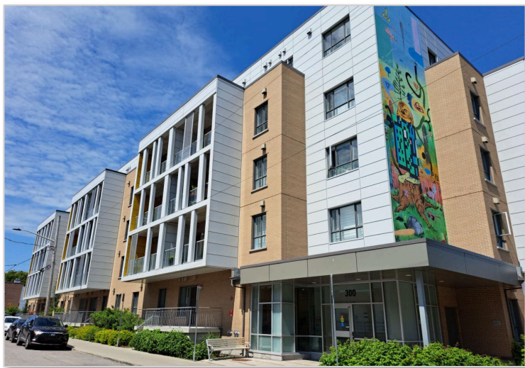
Habitation Durocher 300, rue Raoul Jobin 68 unités