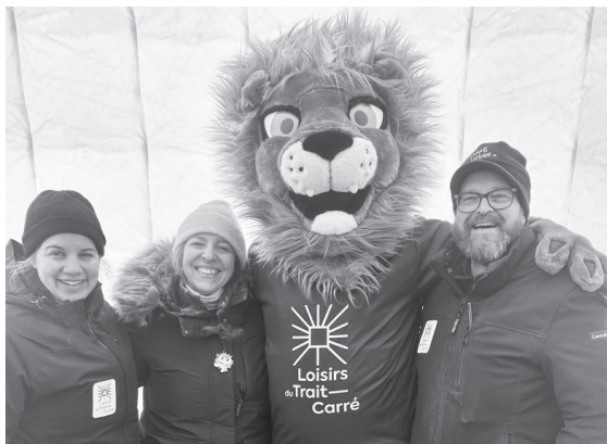
Fête d'hiver au parc Guillaume-Mathieu