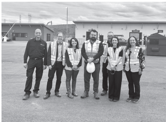
Visite de l'écocentre Jean-Talon (Matrec)