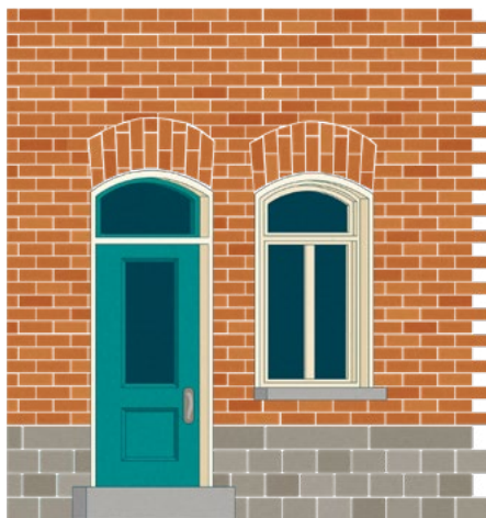
Modèles de porte et de fenêtre à imposte fidèles à la disposition l'origine

À retenir : Plus le modèle de porte ou de fenêtre envisagé se rapproche de l'apparence du modèle original, plus il est susceptible d'être accepté par la Commission.