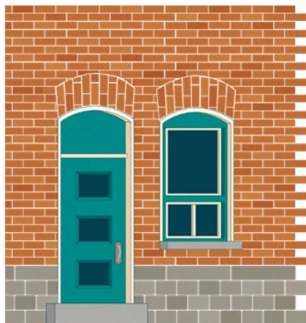
Modèles de porte et de fenêtre non conformes