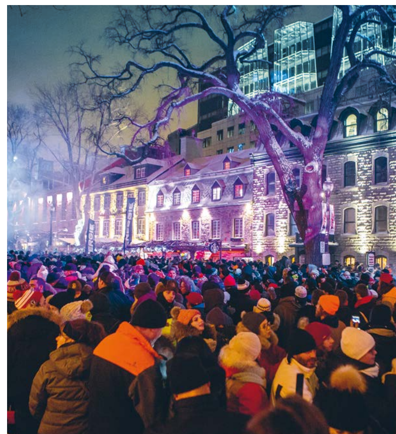
Le passage vers la nouvelle année promet d'être inoubliable grâce à l'événement Jour de l'An à Québec!

Ailleurs dans la ville, d'autres activités et attraits vous permettront de profiter pleinement de l'hiver, dont la Boule à neige géante déployée à la place D'Youville (19 décembre au 12 février) et l'illumination dans l'avenue Cartier. Pour tout savoir sur les activités offertes pendant la période des Fêtes, consultez le site Internet www.ville.quebec.qc.ca/ideesdesorties . Bon temps des Fêtes!