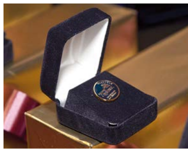
Merci à nos bénévoles

Pour une 14 e année, l'Arrondissement des Rivières a souligné l'engagement de ses bénévoles en leur offrant une soirée-spectacle ayant pour thème Ensemble, on va loin... au Capitole de Québec.