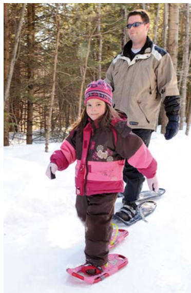
Bougez et amusez-vous cet hiver.

Renseignements : www.ville.quebec.qc.ca/parclineaire et 418 691-4710