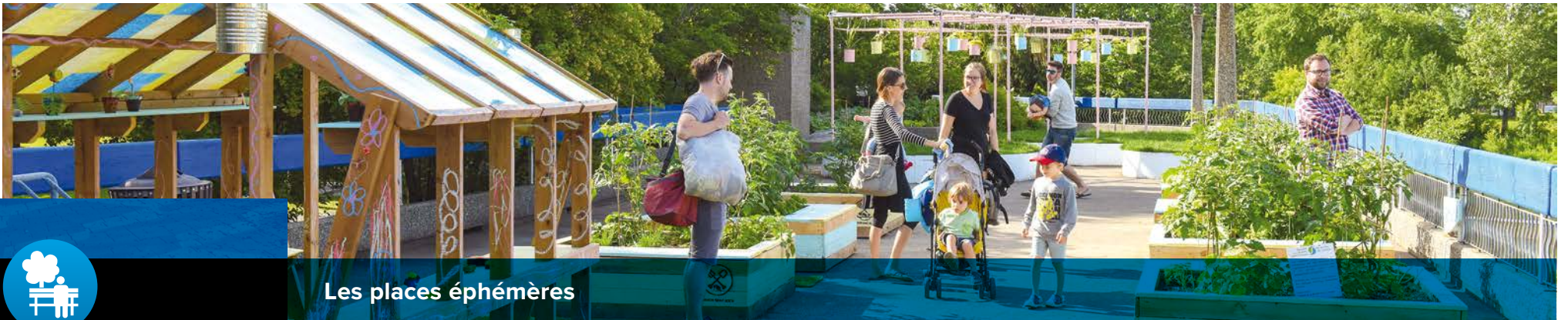
Les places éphémères

Depuis 2013, les places publiques éphémères se sont multipliées sur le territoire de Québec. S'inspirant des nouvelles tendances urbanistiques, ces places permettent aux gens de sociabiliser, de s'approprier leur quartier. Lieux de rencontre, de détente et d'animation, ces endroits sont des havres de verdure et de fraîcheur au cœur de différents quartiers. Aperçu de quelques projets réalisés par la Ville.