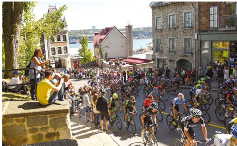
Le vendredi 8 septembre, venez voir les meilleurs cyclistes au monde lors du 8 e Grand Prix Cycliste de Québec.

Le vendredi 8 septembre, les meilleures équipes cyclistes au monde prendront d'assaut les rues de Québec pour une huitième année consécutive.