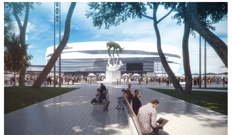
Les 16 et 17 septembre, venez découvrir la place Jean-Béliveau à l'occasion des festivités entourant son inauguration.

Au cours des prochaines années, le site accueillera également le Grand Marché. Celui-ci comptera plusieurs stands permanents, des étals saisonniers et des espaces commerciaux. Produits frais, exotiques et spécialisés, mets préparés sur place, livres, articles de cuisine et